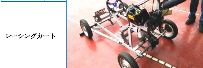
レーシングカート

制御技術科は、『3Dプリンタの製作』、『自動選別搬送システムの製作』、『マイコンを使用したシーケンス制御』、『ルービックキューブ解析装置の設計製作』、『変形ロボットの製作』、『4軸クレーン装置の製作及び制御』、『インバータ制御ブラシレスモータ駆動による四輪走行ロボットの設計製作』の7課題について発表しました。