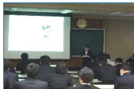
1年生による インターンシップ発表会

お忙しい中、快くインターンシップを受け入れていただいた企業様に、厚くお礼申し上げます。