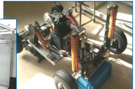
四輪走行ロボット